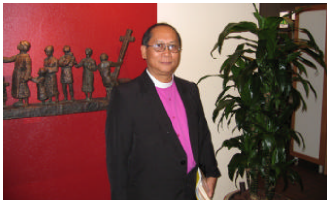
Biskop Ephraim Fajutagana

Elenore Kanter från utrikesdepartementet skulle